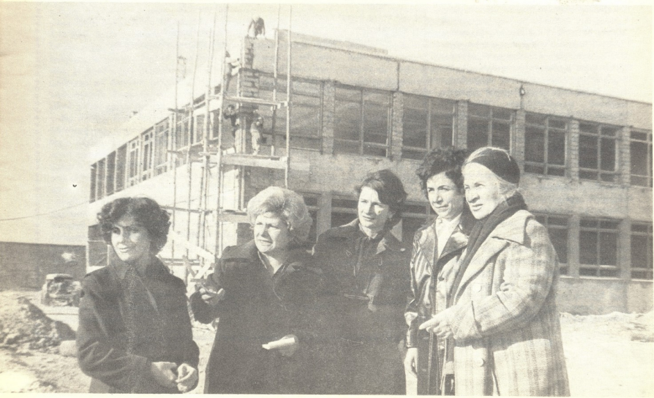
ქალთა საბჭოს წევრები საკვირაო კომისიის შენებლობაზე

მეტი დასასვენებელი სკვერები, ბავშვთა მოედნები, საწყურბალოები რაიონი თითქმის ყველა დღესასწაულს ამ სიხალეებით ეგებება. და ამში ქალთა საბჭოს დედათა და ბავშვთა დაცვის მუდმივი კომისიის კეთილი ხელიც ჩანს. ეს ხელი ერია საწარმოო გაერთიანების „საყოფაცხოვრებო ქიმის“ გამწოვი ვენტილაციის გაუმჯობესებაში, სამედიცინო მომსახურების სრულყოფაში. ქალთა საბჭოს ხელი ერია განათლების განყოფილებასთან ერთად ბავაბალის პედაგოგთა ნამუშევრების გამოყენებაში, რომელიც ყოველწლიურად ეწყობა აღმზარდელთა კვალიფიკაციის ასამაღლებლად, ქალთა საბჭომ დააყენა საკითხი — ცალკე შეიქმნას რიგი მრავალშვილიანი