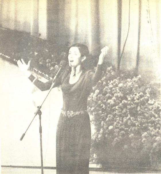
მღერის თამარიკო ვერტინილია

საბჭოთა მუსიკის ფესტივალი თბილისში ზემით დამთავრდა. ძმობის იდეა, მუსიკის მაღალი ჰუმანური პაიოსი კი დარბაჩვენი ხელოვნების ხელონიდელ დღეს.