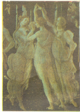
სანდრო ბოტიჩელი — „მასკუსული“