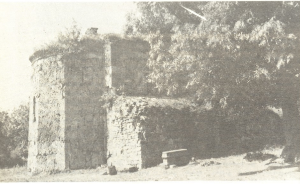
19-17 საუკუნის ღვთისმშობლის ეკლესია