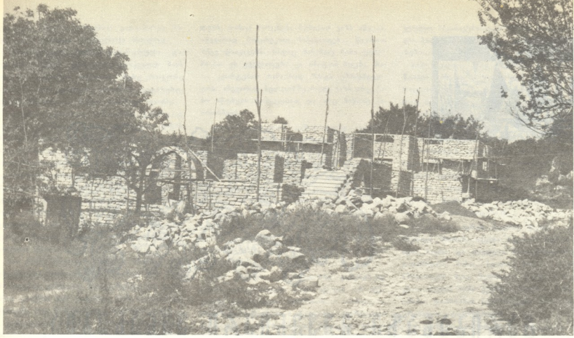
ახალი გომურების მშენებლობა

სწერა, რომ მათი გამრჩე ხელი უკეთეს სიფელს ააშენებს.