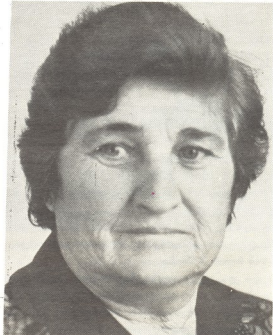
... როცა უღმობლიო მტერი ვერაგულად თავს დაესხა ჩვენს ქვეყანას, კლავდა ტყცობამტეე გაზაფხულს შემხაროდა მხოლოდ... კომავშირულ ქალიშვილს გული მტრისადმი რისხვით აეგოს. მოხალისედ წავიდა სამშობლოს დასაცავად. იგი საპატრიო სადაზერევი ქვედანოფლებში ჩარიცხეს... 1942 წელი. ქ. ნალიკი... 1948 — ალგირა... 1944 — ორჯინიკიძე... კლავა პლიცეას მახვილი თვალის წყალობით მტრის არა ერთი თვითმფრინავი ბელკობრილი გაბრუნდა უკან, ბევრიც განაფტრდა.