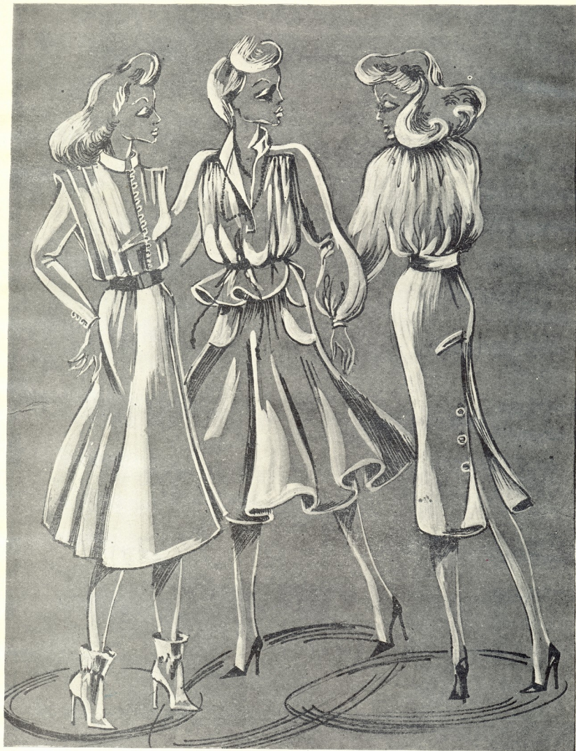
მოდელის ავტორი მხატვარი, მოდელიორი ია სხირაშვილი