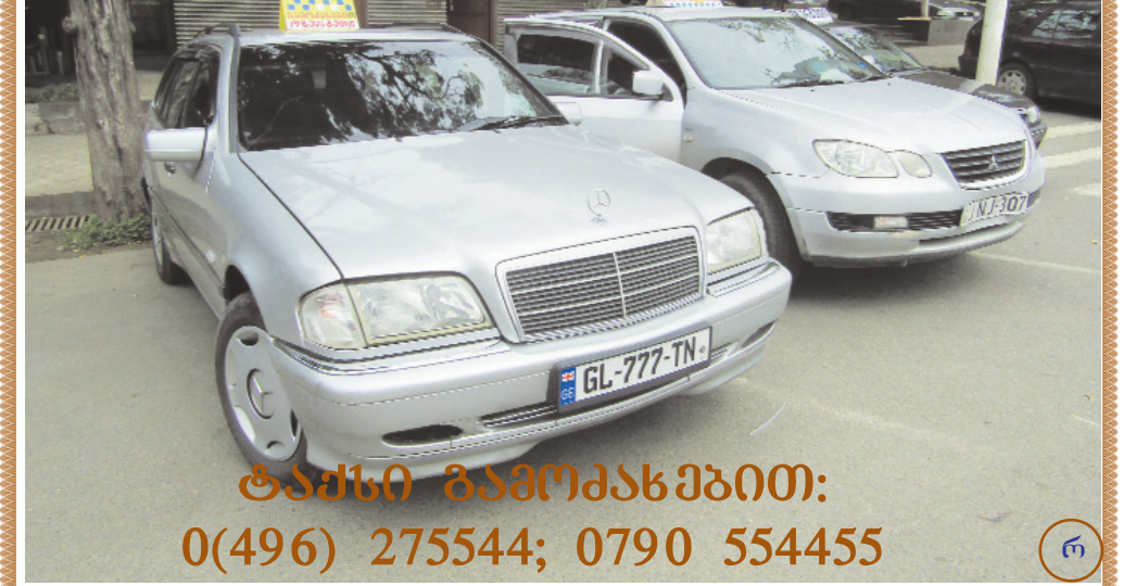
ტაქსი გამოკახებით: 0(496) 275544; 0790 554455