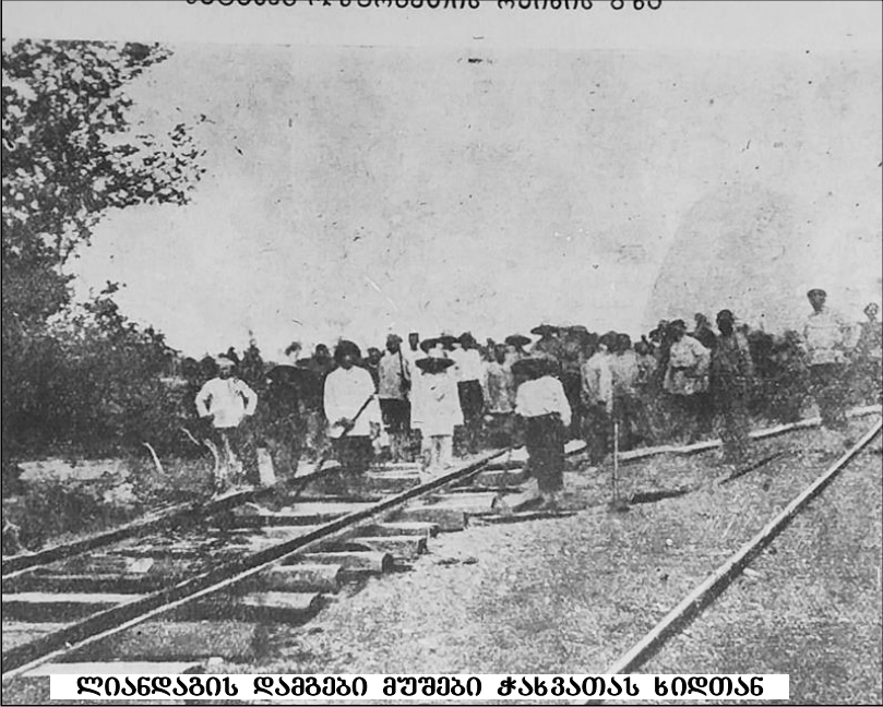
ლიანდაზის დაგებაში მუშები ჭანჭათას ხიდთან