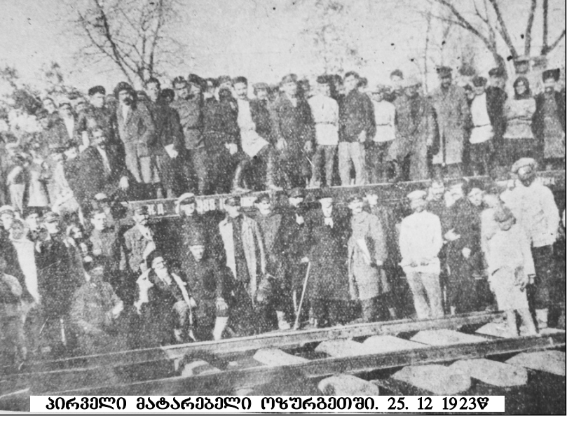
პირველი მატარებელი ოზურგეთში. 25. 12 1923წ