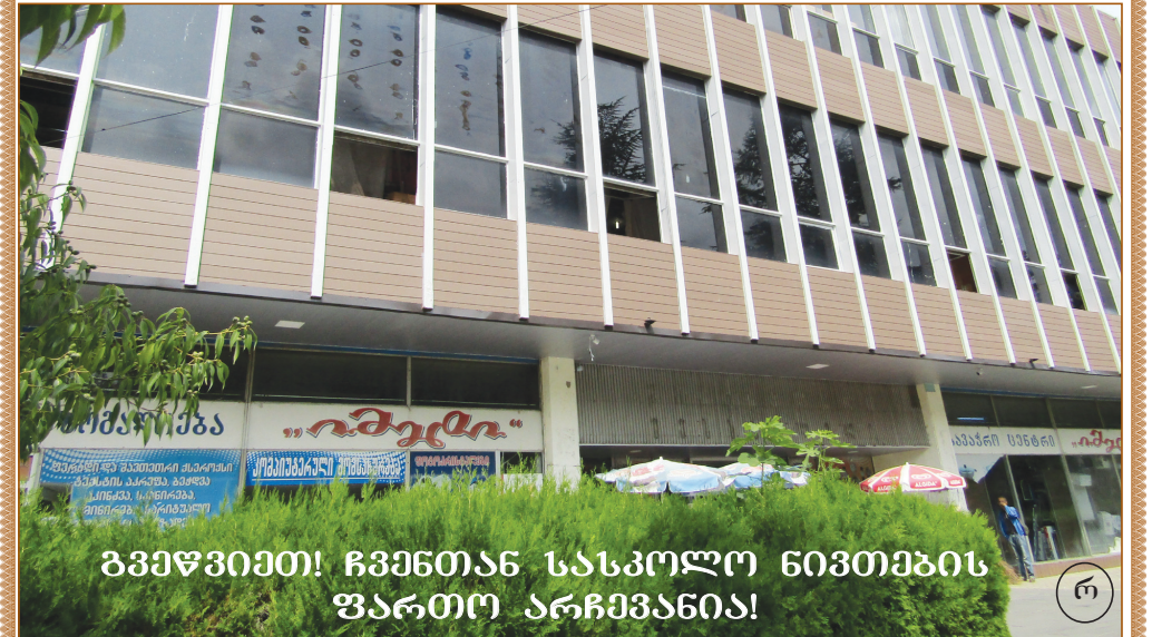
გვიფიქრეთ! ჩვენთან სასკოლო ნივთების ფართო არჩევანია!