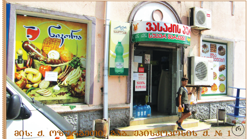
მის: ქ. ოზურგეთი, ვაკ. ეპისკოპოსის ქ. № 1