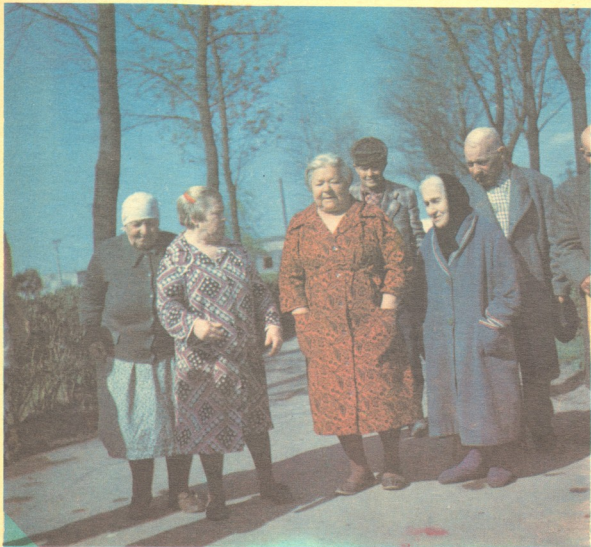
მოხუცებს სუფთა პარკზე სეირნობა უყვართ.