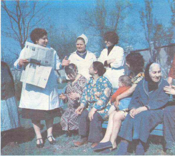
ქცნობან გაზეთის ახალ ამბებს

ქუთაისში გაზაფხულია და ატმისა და ტყემლის ვარდისფერ-თეთრად აფიქტებელი უკავილღების სურნელი ტრიაღებს. მოხუცთა კარმიღამოში კი ვერ გაიგებთ წლის რომელი დროა. აქ წლეების მანძილზე არცერთი ძირი ხე არ დაურავთ. 1968 წლიდან რამლენიმე დირექტორი გაათავისუფლეს და ახალი დანიშნეს, მაგრამ სხვა საქმესთან ერთად მთავარი ამბავი მაინც ვერ მოავარეს. კარგი ხელმძღვანელის ხელში დღემდე ხეხილის ბაღი და ტყეპარკიც გაშენდ-