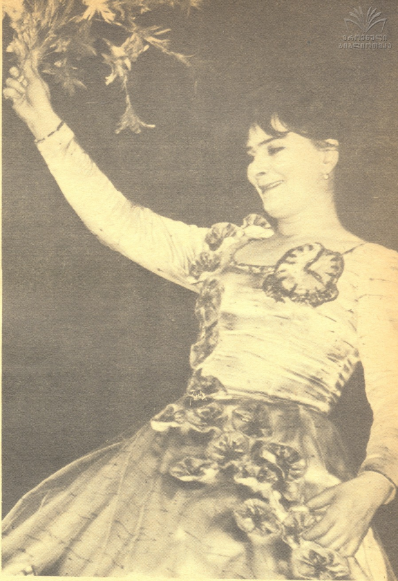
ბრ. გორინის «ბარონ მიუნაუზენის ცხოვრება და გარდაცვალება», ქ. კიენაძე.