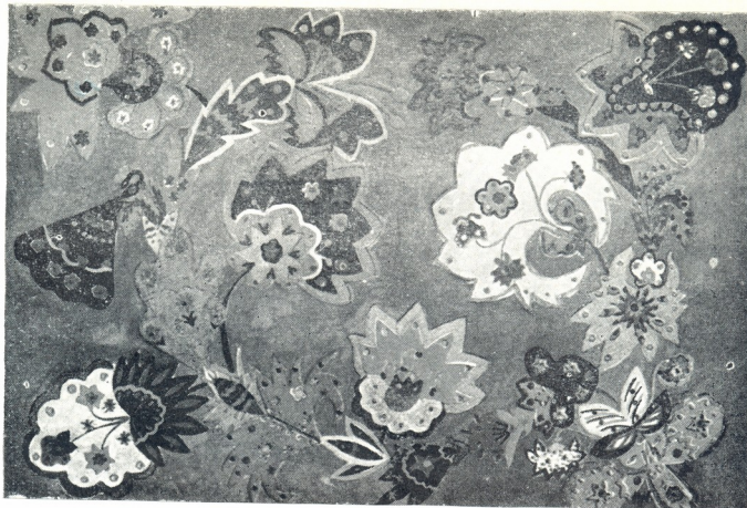
„ტაბოის სტუდის გერაგინი“ ლულა მანუელა (მეძვესე კლასი)