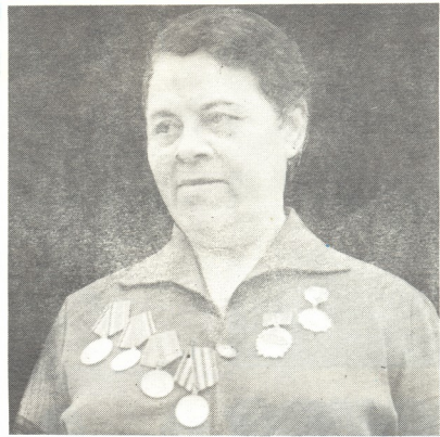
სამაჯულო ნინო ქეო

თბილისის ლენინური კომპაჯვირის სახელობის მოზარდ მავურებელთა სახელმწიფო რუსული თეატრის მონოლითური, ნიქიტერი კოლექტივი შემოქმედებითი სიწიფის ხანაშია. მისგან კვლავ შექმნილი ახალ გამარჯვებებს, ცალკეულ მოვლენებითი მიღწევებსა და წარმატებებს.