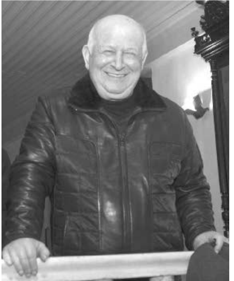
გამოვლინებაა, არამედ მეტროპოლიტის ნებაა.