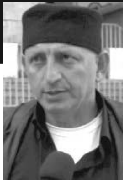
გვრამიას კანცლერი მერკელი გვსტუმრობს. რა პოლიტიკურ პროცესებთან გვაქვს საქმე, რას უნდა ველოდეთ?