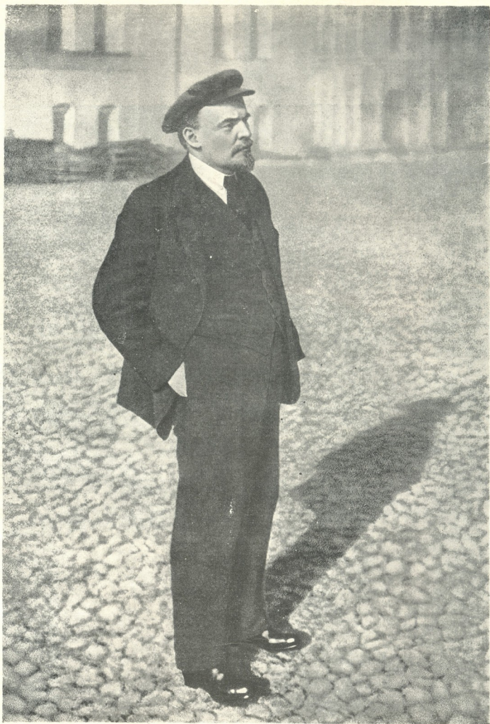
3. 0. ლენინი კახელში