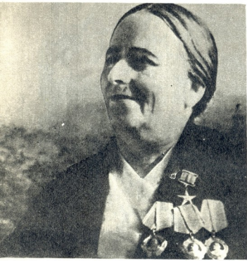
სოციალისტური შრომის გმირი ახანა ვრეჯავაძე

ნენ გასაყიდად თორმეტ ათასამდე მონას, რომელთა რიცხვში ხუცუბნის მეკრდიან სამუდამოდ ავღეილი შვილები ერთა. დასვა საზარი ხანა, ქართველ ასულთა ლამაზი სხეუბი ჩაღრთი დაიფარა, მაგრამ სამის წლის განმავლობაში თურქებმა ხალხის გულიდან ვერ ამოფიქრებეს ის, რაც წინაპართა გულებში აყენის რწევასთან ერთად იყო ჩასული — შრომობური მიწაწყლის სიყვარული.