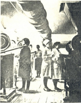
კაზის შემღებელ სამჭროში