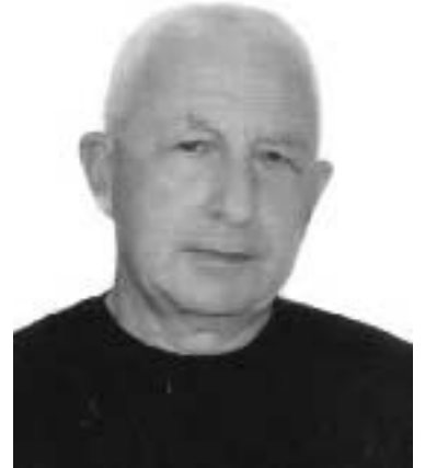
არის დაკავშირებული ბალაძე რაიმე შავადის მკვლელობასთან?