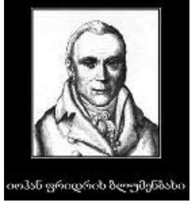
დავიდ ლეინის ბლუმიუნგის

„დაცვა საკუთარი ჯიშის — ბუნების პირველი და უმთავრესი კანონია“ — ამბობს ის „ თეთრი გენოციდის მანიფესტში “. თეთრი რასის მებრძოლებს გენიალური თოთხმეტი სიტყვით მოუწოდა დევიდ ლეინმა, — ჩვენ ვაღიარებთ ვართ დავიცვით ჩვენი ერის არსებობა და მომავალი თეთრი ბავშვებისთვის“. „88 მცენებაში“, „სტრატეგიაში“ და სხვა სტატიებში დევიდ ლეინი გვიჩვენებს გზას, რომლითაც შესაძლებელია განთავისუფლების მიღწევა და თეთრი საზოგადოების შენება. რაც შეეხება რელიგიას სამწუხაროდ იგი თვლიდა, რომ ქრისტიანობა საზიანოა თეთრი ადამიანებისთვის, ვინაიდანაც მისი ფილოსოფია უარყოფს ბუნების კანონებს. ის ევროპულ წარმართობას თვლიდა თეთრების ორიგინალურ ჭეშმარიტ რელიგიად. საინტერესოა ლეინმა, იცოდა რომ კავკასიაა თეთრი ადამიანის სამშობლო? ან, „თეთრი რასის გადამრჩენელი“ იცნობდა რასიოლოგიისა და ანთროპოლოგიის მამის ფრიდრიხ ბლუმენბახის ნაშრომებს? მან 1795-წელს საქართველოში აღმოჩენილი თავის ქალის შესწავლის შედეგად დაამტკიცა, რომ სწორედ კავკასია არის თეთრი ადამიანის სამშობლო. ბლუმენბახი წერდა: „კავკასიური ტიპის შესწავლისთვის მე სწორედ ეს ტიპი, კავკასიის მთის ტიპი, ავირჩიე იმიტომ, რომ მისი სამხრეთ ფერდობი ქმნის ადამიანების ყველაზე ლამაზ რასას ამ რასაში მე პირველ რიგში ვგულისხმობ ქართველებს, ყველა ფიზიოლოგიურ თვისებას სწორედ აქამდე მივყავართ. აქედან გამომდინარე ჩვენ შეგვიძლია დარწმუნებით ვამტკიცოთ, რომ კავკასია არის თეთრი ადამიანის დაბადების ადგილი, თუკი ჩვენ სადმე უნდა განვათავსოთ კაცობრიობის ავტოქტონების (თავდაპირველი წევრების) საცხოვრებელი, ყველაზე დიდი ალბათობით ეს უნდა მოხდეს აქ, საქართველოში“.