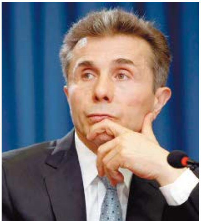
რობამ“ ცხრა წლის განმავლობაში 16 მილიარდი „აითვისა“ და მიიტაცა.

ექსპერტების და ანალიტიკოსების დასკვნით, „ნაცმოდ-