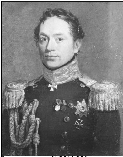
კავკასიის მთავარმართებელი როზენი

განსაზღვრელი გავლენა როგორც ოზურგეთის ასევე მისი ქვეყნის სოფლებზე სავაჭრო საქმიანობასთან დაკავშირებული საკითხებზე – აქ გამართულ ბაზრობებზე ოზურგეთის მოურავს – ნაკაშიძეთა გვარიდან ჰქონდა მინდობილი, თუმცა უკვე ახლა ქაიხოსრო გურიელის მიერ დაწესებული გასასყიდი საქონლის ნიხრი, მხა-