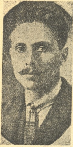
თეთრი ტერორის მსხვერპლი მსტონეთში, შიან ტომი.