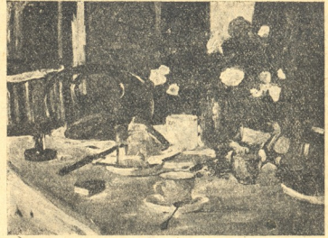
ვ. სიღიმარი—ერისთავი—მეფარი ბუნება.

შვილის ამბავი რომ უხაროდა დაკარგულად ნაგულებსა, მის სიხარულს ის უფრო აძლიერებდა, რომ გამთავნებელი უბრუნდებოდა იგი: რძალს მოჰკვრდა და მერე რა რძალს! მშვენიერია, ესეთს ქალს მანდ მეორეს ვერ იპოვო. ფულიც ბლომად ეშოინა. ეტყობოდა გამოინახავნენ, წერილის კილოს.