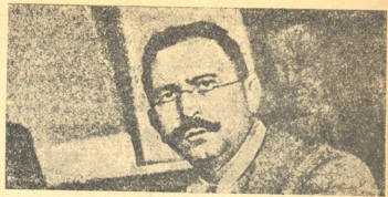
„ზინოვიევის წერილის“—ნამდვილი ავტორი მისტერ ტრეზინი—ლინკოლინი. დიდი გაიჭვრა, გვრმანდლებს ჯაშუში ამერიკაში, იტალიის კონტრ-დახვერვის წვერი.

ორივე ხევი მოვარდნილიყო, ბროლაური და ქივჭავიძე. ისე ავსებულაყენენ ნიაღვრით, რომ შერითებულაყენენ, დაეფარნათ სოფელი. არემარე თან მოჰქონდაო. მთელ-მთელ ხეებს ჩინხზვარივით ატრიალებდაო. სახლები დაენგრიან, ბალ-მინდორი გადაერეცხა; ყველაფერი გაენადგურებინა, დაელუპა. თვალდაანთ სასახლე მაინც გაჰმაგრებიაყო: მაღლობზედა სდგას და მკვიდრი გალაგანი არტყია. ღვარს მოვგოჯანა მთელი გორაკი, გადმოვგრიან; ამოქინა უწინდელი შენობები თუ აკლდამები. წყალი რომ ჩამომჯდარიყო, მათ წინაპარს ნანგრევებში ეპოვნა ის ძვირფასი თვალცი. ვანძი დაეკრძალა ლუსკუბაში და ანდრძი დაედა, არას დროს არ გამოეწირინათ ის სავარეულოსათვის.