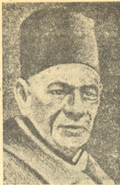
ზაგალულ-ფაშა—გეგბიტის პირველი-მინისტრი. თავი გაანება მთავრობას კონფლიქტის გამო.

შემპირდნენ დიდებს, გვიშველიანო. გამოპოვოდათ მათ დიდრონიებს ძალა ქმედობის.