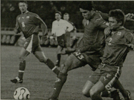
უტანს დაფიო სირაქა

ვიდრე ის საკმაოდ კარგობის ანგობაზე ხარჯანს, შეუძლებელია, რომ ექტორ კუპერის სახელით (11 თებერვალი) გამოიხატოს. მართალია, სირაქა უფროდარს, მაგრამ ერთი დღითაც არ ვაგვიერებოდა - თბილისი ყოფილი „ლოკოტივი“ ვარჯიშის საშუალება მისცეს. წესით, მისი უფი თურქეთში უნდა გადასულიყო და შეუძლებელია ვაგვიერა, ვეცხვარვის მიმხედვლად უნდა შეეცდეს.