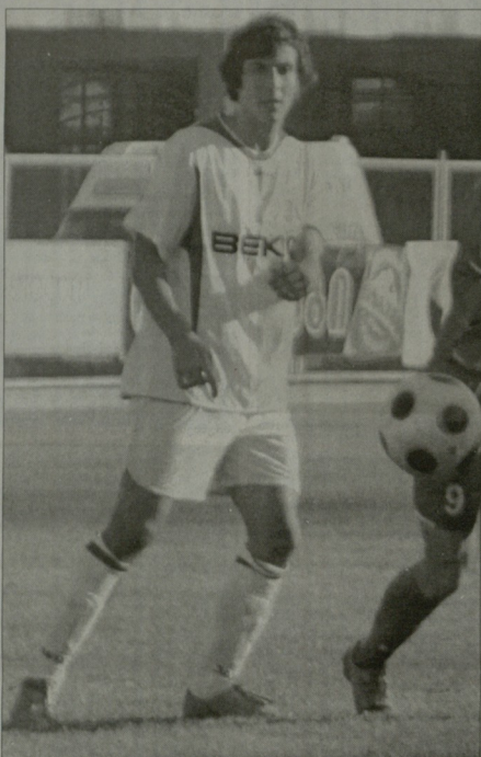
ვარი სამიზნება, შედეგების წამოწმება უფრო ხალხი, ვიდრე მცდელობა. თუმცა ისიც მისს, რომ გუნდის ინტერესები უნდა გათვალისწინო - სადაც უფრო სანტრერული ვერ ეყოფიან...