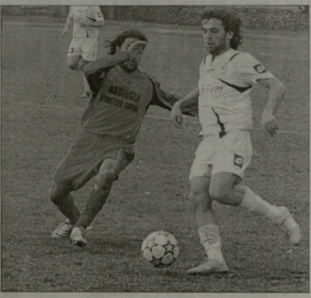
მატარა და კობა სტადიონი გავაგეუსაბრეო, შავსო ათას მატურებულს იტეხს და, რაც შედეგობა, უფას სტანდარტებსაც ვაგეუსაბრეობს.

მსოფლიო კონომიკური კრიზისი სურათში კლავებს შავსო. ამ შავსო, სიონიერა რა დავითი ბაში? - ვერ ვაგეუსაბრეო, ჩემთვის კრიზისი არ შედეგობა და იგივე მაქვს, პრობლემები არც მქონე ვაგეუსაბრეო... - ახალ სტრატეგიაში რა იტეხი?