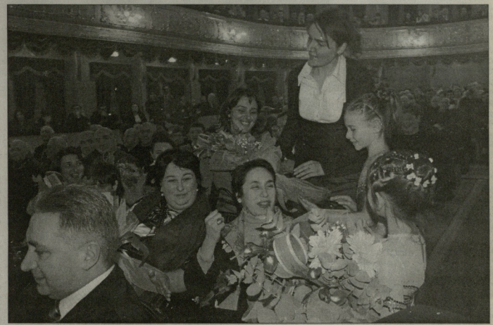
წლის საუკეთესო გუნდი - მოჭდარაკ ქალი ნაკრები

დასახლებს ისიც ვინდა აღღინონი, რომ გუნდებელმა საღიბო მართლაც საღელღესაწყო ვითარებები ჩაიკა. სახეობი ცერემონილი ოლიმპიადის ტირონის მცველ სახელმწიფო ანსამბლის, გურამ საღარდოს, კოორღლების მუშდედუცა ანსამბლის, გიო ზუციშვილის მუშდედ კორეის, ანსამბლ „ლიდაროს“, კახი კვიციანის, გიო ზურკაძისა და სხვა მსახიობთა გამოღღებამაც დაამყენა. სეზონი მავორულ სიტუაც დაკვირვებდა. პირველი იანღერედი კი წარმატებების ახალი ათულა დაიწედა.