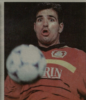
ესიც უნდა გახსოვდეთ: როგორც სპორტული კაპიტანი