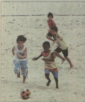
როცა დეკემბრის ტურებში ტრენინგის ცენტრში...