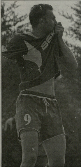
ლი მშენიერი ჩემპიონი. ამიტომ, მინდა, მაგალითად გადავხალო მისე მთავარ მწვრთნელს. მისკანა აღე შედის ვინცინო და ეს ძალზე მასარებს, სტრატეგი მადლეს. ვინც იცის, დამჯობნება, რომ ფეხბურთისთვის მწვრთნელს მზრდის განმეგება და დღისა ძალიან მუერს ნიშნავს.