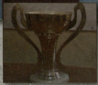
პრესკონფერენცია და ისტორია