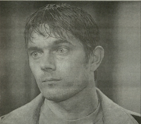
ფლო კოქი ინფორმაციის მქონე გუნდისა და პოლიციის წარმომადგენლები