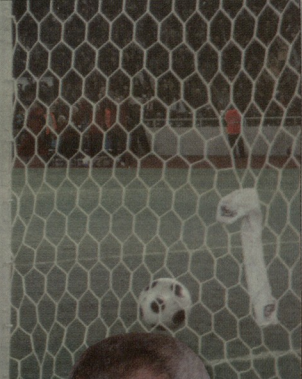
73-ე წელი, ლევან კობიაშვილის გოლი