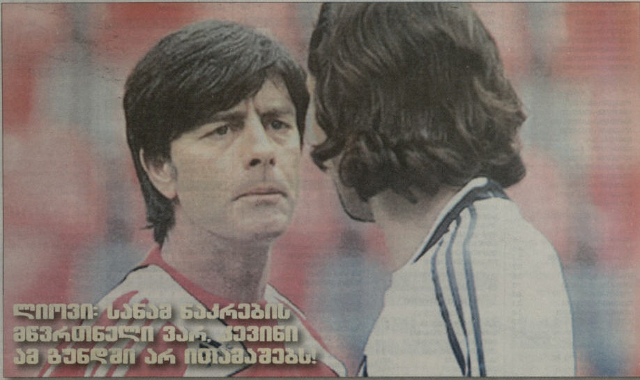
ლიოვი: სანამ ნაკრების მწვრთნელი ვარ, კვირი ან გუნდში არ ითმავა.

მისედ რატომ გადავიდა კურანიმ ეს საბოლოო? მისი არგუმენტები ასე ფერის: „მწვრთნელი არ მენდობა, რაც ჩემთვის შეურაცხყოფელია. რუსეთთან განაცხადში რომ ვერ მოხვდებ, ეს ბოლო წელი იყო. ფაქტია, ლოვის არ ვჭირდები. მეტის მოთხოვნა შეურაცხელია.“ ფეხბურთელის ამ ბეჭდის საქციელმა გერმანიის ნაკრებში დიდი დისკუსიები გამოიწვია. კურანის თანაგუნდელებმა გაკვირვებულნი არიან და მიიჩნევენ, რომ ის არასწორად მიიქცა. ყველა დარწმუნებულია, რომ კვირი ნაკრებს სჭირდება. კურანის დიდი ხანი კურანის საქციელს თავად ლოვიც გამოეხმაურა. აი, რა თქვა ბუნდესმწვრთნელმა: „დახს, ის განაწყენდა იმის გამო, რომ განაცხადში ვერ მოხვდა, რაც სავესტო