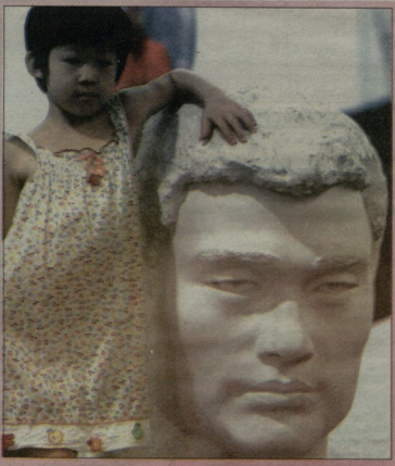
იაო მინი და ბავუები.