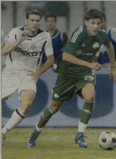
კოსტის (მარცხნივ) ივანაბტი გაცემა