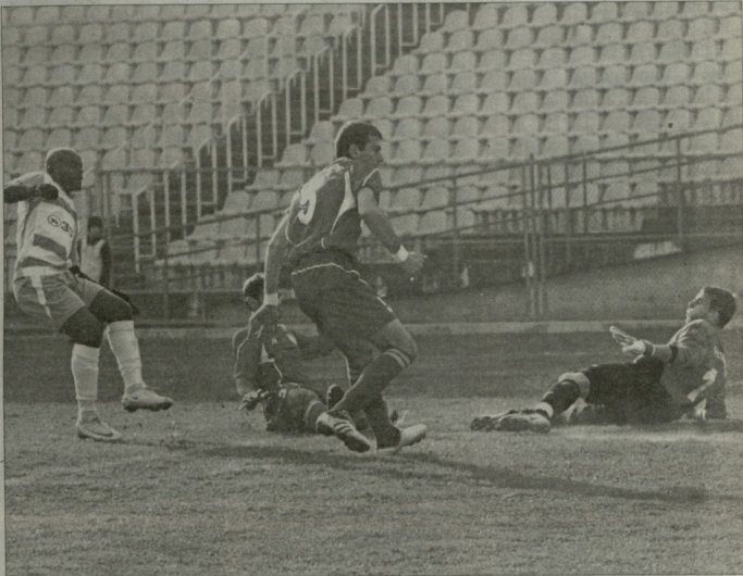
ანგარიში ვორე აკრემიშე ცახსანა