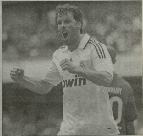
იან რაიჭი არსენ ვენგერს რუდე ვან ნისტლერის ვიდვას ურჩევს

...ახლა სხვა ვთქვათ: „არსენალის“ დაცვას და ნახევარდაცვას ნამდვილად არაფერია ვერჩი. აუ, მეკაროს ბროშოლებს კი მადუერებს, კლუბისთვის, რომელსაც ჩემგონობა უნდა მანუელ აღუბინა ჩემბოლი მყოფი მეკარე, მაგრამ მათი გოლიკონარა ბრინ სხვა დონის ისტატისა სავარა, რომელიც ვენგერს უნდალესტი კატეგორიის მეთორ ვეჭვრებდა, თნ ამ თამაშს უღალატარო ვადავებო.