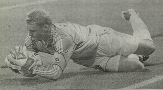
შეცვლის მანუელ ნოიერი ედვინ ვან დერ სარს?