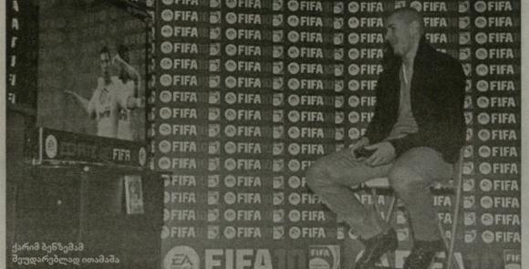
კარმ ბენზემა მწვერულად ითამაშა

ვირტუალური კლასიკო: 3:0, რონალდუს ჰეტი თრიკით