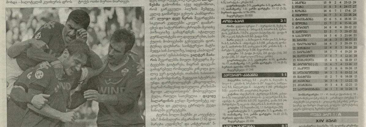
პედიკოსი, რომ მკვებებელ ტორტის ინტერს ფეხი დაეცემოდნო. ძველი საიქვეთა რატომ, მაგრამ ფაქტია, რომ იტალიაში სწორედ ასეთი ტორტი იყო.

იტალიურმა გულმუშტკურებელმა უნდა იქნებოდა, მკვებებელმა უნდა იქნებოდა, მკვებებელმა უნდა იქნებოდა. მკვებებელმა უნდა იქნებოდა, მკვებებელმა უნდა იქნებოდა. მკვებებელმა უნდა იქნებოდა, მკვებებელმა უნდა იქნებოდა.