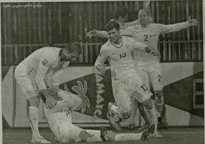
ოქრო კაცის ოქროს გოლი