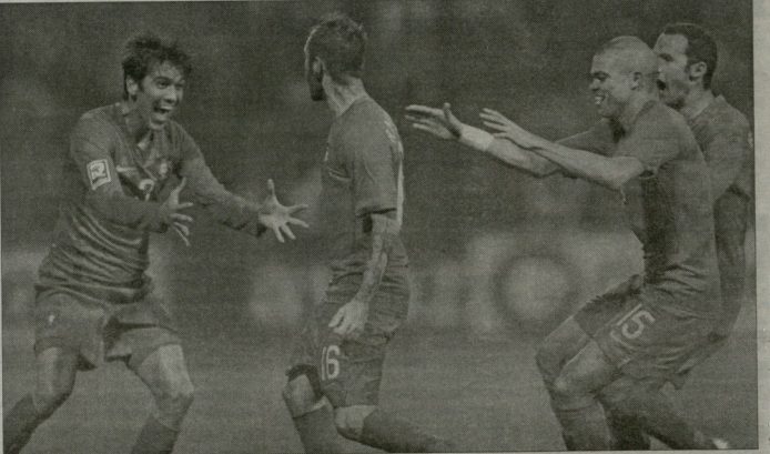
პორტუგალიელები გამარჯვების გოლს ხაზობენ

ალტორი: ჩაქრა, ვუგერი, ბუგაივი, იაპია (66. ზაუი), პალიტი, მანერი, ჩეზალი, საფი (85. გილასი), მუენი (58. მატმური), იგიდა, ზიანი. ვაიანია: ვეკოვი, აღ მუხამედი, ზაქერი (75. უფი), პეტერეკი, საფი, დიპი (46. ზუდანი), მუტეტი, მოავდი, ზაქი (46. აბე რაპი), პასანი, გომა. გოლი 1:0 იაპია (40) მყურებელი: 5 000