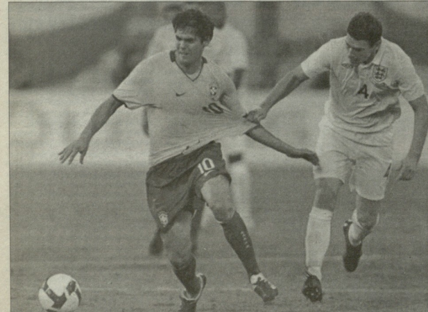
ქავას ასე თუ გაატრება...