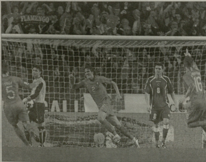
ბრუნი ალვესი გამარჯვების გოლი გაიტყვს

პორტუგალიამ ძლიერად დაიწყო და მალევე ლიდერმა ხელსაყრელი პოლონიკად ააცილა, ამ თამაშს ნატვრული შეზღუდუ პორტუგალიის მსაკავის რამდენჯერმე დამბტია. ნანი ძალიან აქტიური იყო მარჯვენა ფრთხზე და სულად ამ სრის გასაკვირი, რომ პორტუგალიამ ანრიკო ამ ულენიგან დანეხბული შეტყვევით გაიტანა. ნანის ჩანდებ-