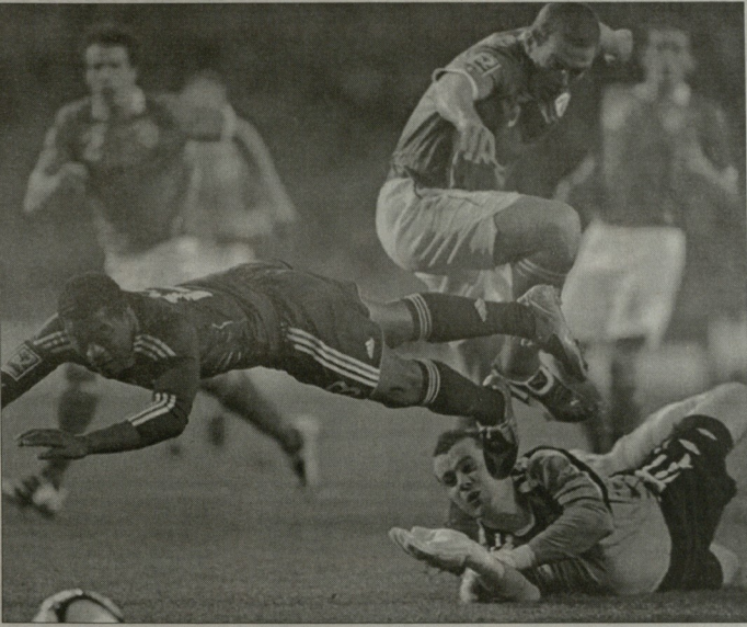
მატჩის ვერა ნაიქა თუ ნაიქივს?

მეტი ირლანდიელებმა აღმოჩინეს, რომ ერთად ვალიკა ვაიკი კრიკ აბილი არაფერ სურათსდა თანამბდენს საქართველო თანამბდებლებს, ამიტვრცე მალე ჩანდებულზე გადავიდნენ. 28-ე წუთზე მასამბლეტის წესით ანგარიში უნდა გაესწინა, როდესაც ანგარიში ირლანდიის, რომლის დარტყმული ხელი მამბილიდან უკო ლორისმა მოგერიკა, ლუდვიგის დამბტებელი კი ძელს მოხდა.