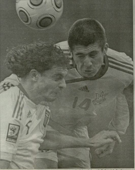
ხარისხებისა და ხანრილის საპარანო დელი

საპარანო-პარანა 0:0 საპარანო (5-1-3-1): კორკოტი - ვინტრა, პასსტატი-ლოსი, პარანი, კორკოტი, სანტროვოლი - კავერინი - სალპინდელი (71). მორილი, კარაფინი, სანტროვოლი - გეკატი (65). ნარსისკატი. უკრაინა (4-4-2): პოპოვი - კობინი, რაკოვი, ხანრილი, კურენი - როტიანი (46). იანკოვიჩი, ტიშოშუცი, მიხალიკ, ბუსელი (83). ალივი - მილენკო, შევერსკი მათურებელი 35 000