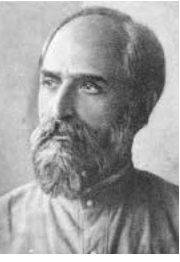
დოგმატური და ორთოდოქსული შეხედულებებით, მომავლის მშენებლად ვერ ივარგებს.

მათ შესარულეს თავიანთი მისია — გამოიარეს კატორღა, ციმბირი, დევნა, წამება, ოქტომბრის რევოლუციის შემდეგ იბრძოლეს, იომეს და სასტიკად გაუწესორდნენ კლასობრივ მტერს, მაგრამ ეს ძალი უკვე გუშინდელი დღეა, წარსულია, რომელიც თავისი