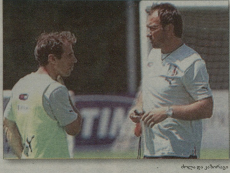
ძოლა და კაზირაგი