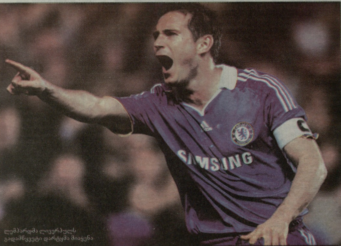
ლემპარკმა ლიგერულს გადაწყვეტილი დარტყმა მიადგინა