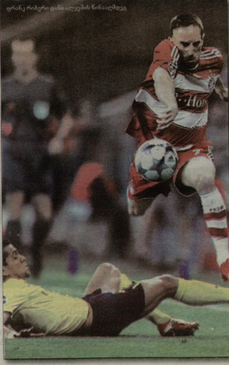
ფრენს რობერტი დანაფსივლდობის ნინაფსივლდობა

"ჩელსისა" და "ლიგერულს" შეხვედრის შემდეგ ძნელი ისეთ თამაშზე წერი, რომელსაც ინტერვა ვერ კიდევ პირველი მატჩის პირველ ტაიმში დეკარვა. "ზარსკლიანი" ნანერყინებლობით გავიდა. ყველა იცოდა, რომ ეს ასევე მოხდებოდა. ზოსტე გავრდილას გარდა, აღბათ, არც არსებობდა აღბათი, ვინც "ზაურისგან" ამ შეხვედრაში ოთხ და მტე გოლს ღღდა... ისევ ღღდა იმე მტე გოლს დასცინოდა. დასკე თქვენიცის მოვიდგინა. სიბაროდ ითქვას, პირველგან გახსნებოდა "ზაური" საბინაო შეხვედრის საგებებოთი კლუბს ნამდვილად ჰგავდა - უტყუდა, მეტეტის კარი ურტყანდა, ცოტას ანერტოლდა კიდევ, იმროდა, ბრიოლდის ხანგავიდე მტედან გამარჯვე