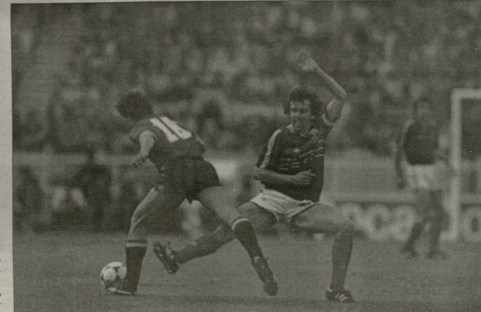
გავრცელება იქნება... ითა მთავრაპივილი