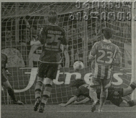
ბრემნული კლავიო ბისაროს გოლი სტ. ტევენის კანი

– ოფენბახში ხელმძღვანელობასთან შეთანხმებული ვარ, რომ კარიერა დაინიშნავს მუშაობაში ფორცე მოიხდეს გამოხატა. თუცა „შალკეში“ ვერ არავინ გულბურთებულე კლუბის მოსტისთვის საკუთარი შეთავაზება, – აცხადებს მიოლიერ.