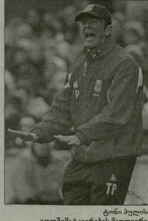
ტონი პულისი გულშემატკირების მადღერია

- მათი ისედაც ივიან, რომ მათი საყვარელი გუნდი მოგვებს და შესაძლებელი ხმის ითვება ზოგადად. დასტურის ვაცხობის შემდეგ "სტოკის" ფანებს განსაკუთრებულად ემოციური სიტყვები მიმართა: მიავარდა მწვინდად ტონი პულისმა, ის, რას აცხადებს ის: "მოგანთავიუ საფეხბურთელი კლუბ "სტოკ სიტსი" სახელით. მინდა, მაგალითი მივუდგავ ვერ იქცეოდა ჩვენთვის სველი ციფრის მატრეწ მსოფლიოს ყველაზე ძლიერ ჩემპიონატში სწორედ თქვენი წყვილით გამოიქცეოთ იქ შედეგებს, რაც დღემდე მათებს ფარგლი დაუფარავარ შეტეგების განხვედრა შეიძლება, რომელიც ჩემ თქვენი ივიანის რაგვიტარება. მაგალითად მამამა ელით მომეფიე პასტინ ვიქცეოს" და ათი პრემიერლიგაში პირველი