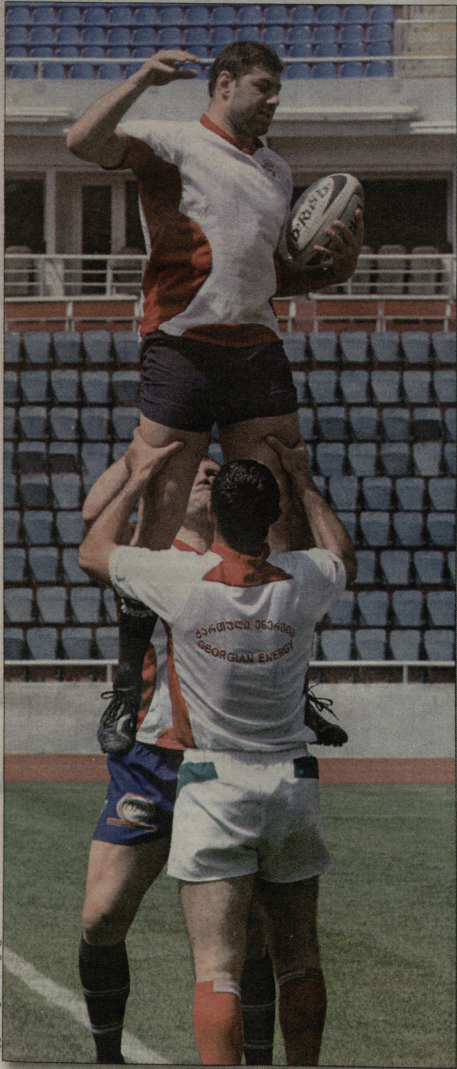
დღეს, ღიღი რაბკი. საქართველო-ესპანეთი »»» 11

ჩამოვალ და მაჩვენეთ ერთი, როგორ ბიჭვართ არბენტინა