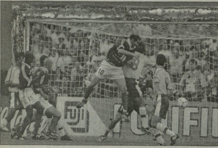
დასასიში "ლელა" №66,92