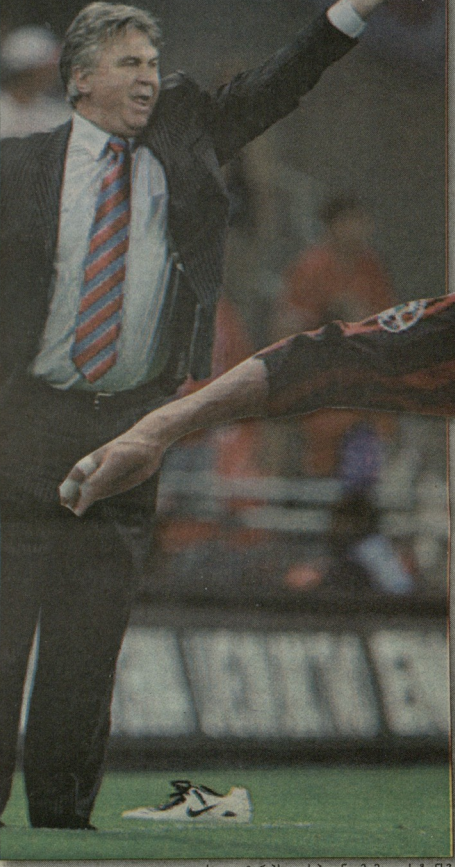
სად გაატარებს ვუეს ჰილნიკი მომავალ სეზონს?

რას იზამს აბრამოვიჩი, გრანდმა რომ ერთი ან სულაც ორი ტიტული მოიგოს?