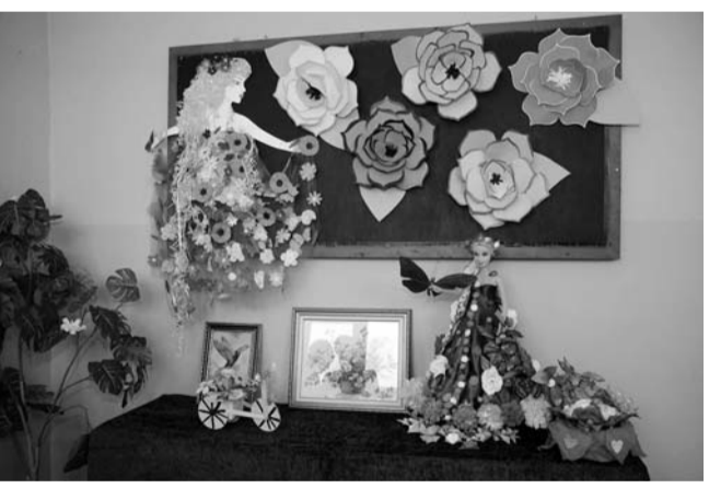
ლის სახით, სამშობლოს ღირსეული მოქალაქე ყოვლება.