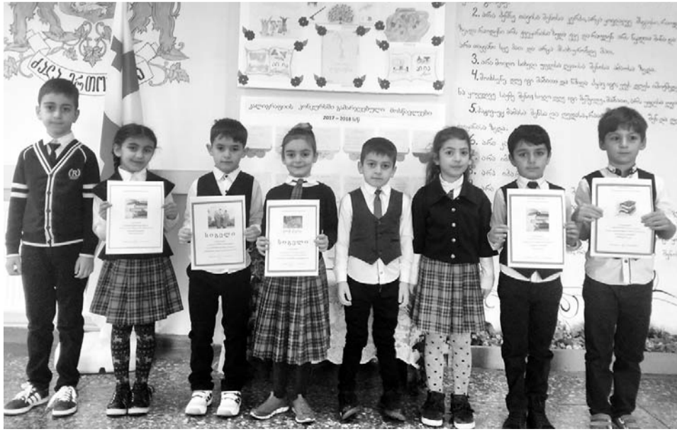
ქართული ენისა და ლიტერატურის კათედრა