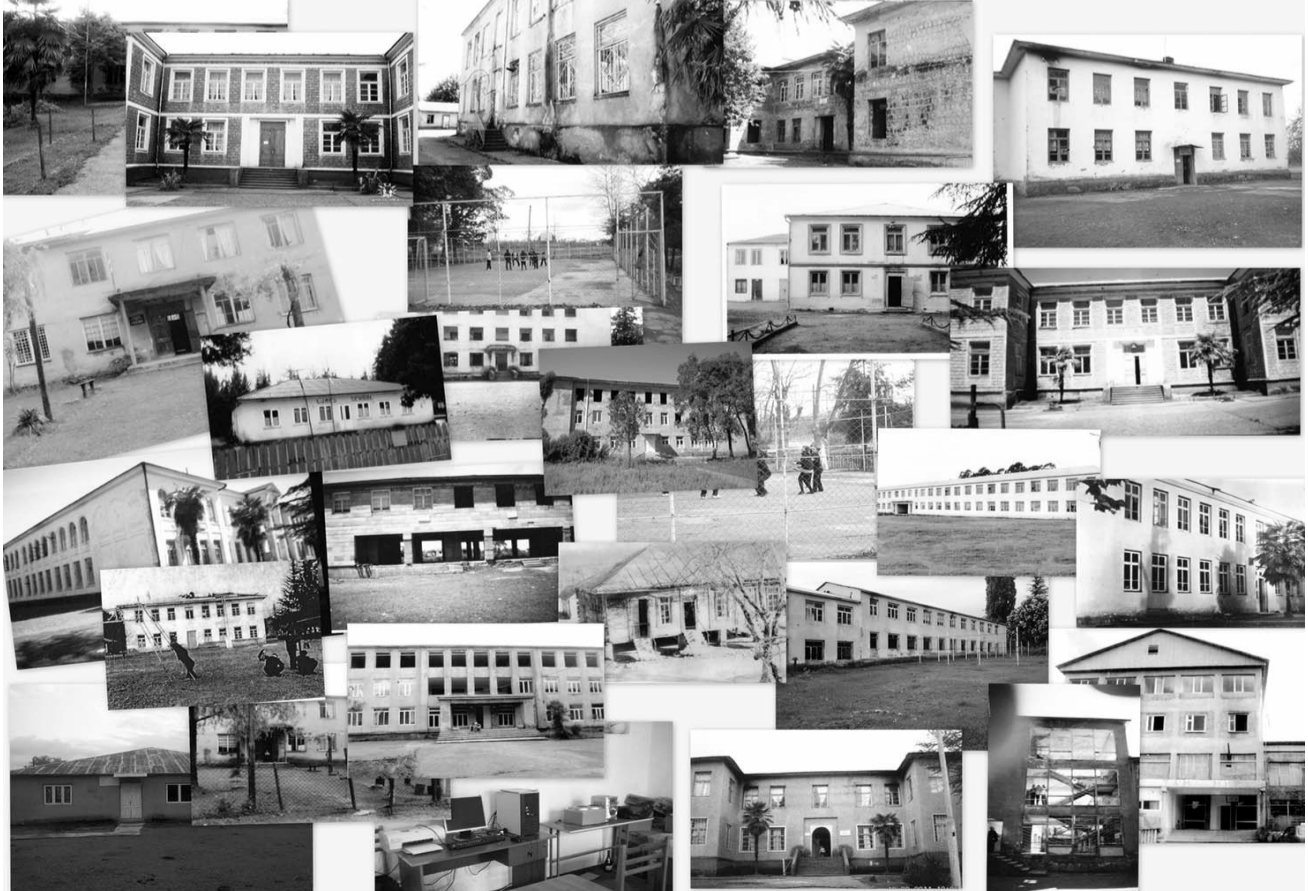
გალის რაიონის სკოლები

აღსანიშნავია, რომ დღეს, აფხაზეთში, საკმაოდ ბევრია სომხური სკოლა. მათ აქვთ უფლება, სომხეთიდან შეიტანონ სახელმძღვანელოები და აკადემიური სომხური ენით განახორციელონ სწავლა-სწავლება. ქართველებს კი, რომლებიც მშობლიურ რაიონში მოსახლეობის დიდ უმრავლესობას შეადგენენ, საკუთარ ტერიტორიაზე ჩამორთმეული აქვთ არა მარტო მშობლიურ ენაზე განათლების მიღების, არამედ გადაადგილების, ცხოვრების, ადგილობრივ ე.წ. არჩევნებში მონაწილეობის, ხმის მიცემის და სხვა უფლებები. ეუბნებიან, რომ არ არიან ადგილობრივი მკვიდრები და აიძულებენ, აიღონ დროებითი ბინადრობის უფლება, რაც საცხოვრებელ კარ-მიდამო-