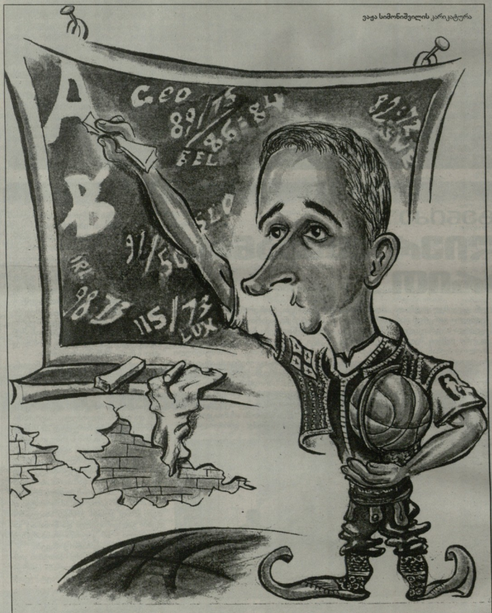
ავა სიმონიშვილის აკრიკატურა

იგორ კოკოპოვმა ყველა სქრად ვაკვიტე და ის ნაკვირვად ვაკვდა, რაც ნაკრებისთვის იყო სასტრუქტორული.