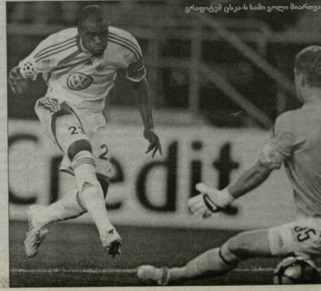
ფეხბურთი სტეპ-სი გილი მიაჩნდა

Vertical text on the right edge of the page, likely a page number or publication info.