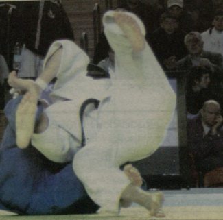
>> ბაიერნი 11

ქიუდოს სამხარობი შეიკლება ახალმა სკანდალმა იფეთქოს