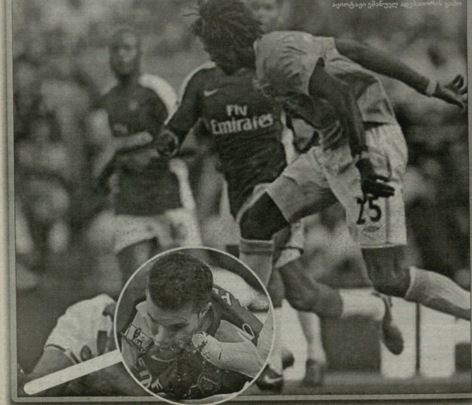
კობიტე ვანაშელ ადგილობრივი განი

სანტრესისა, რომ პაპარაციებმა ბექქმესის თვახს ბოლო დროს, ჩამდვლით ისეთი ფიტე გაყავულეს, სადაც ზურვად ვეტირის დავერთო უნიდელი თანაგუნდელი და ვალბეშეული არ ჩანს. თუმცა ჩამდვლით მუხიხევეითი ციტე ბექქმესი რომ არავცერს ნინივას, ყველამ კარგად ვეციო.