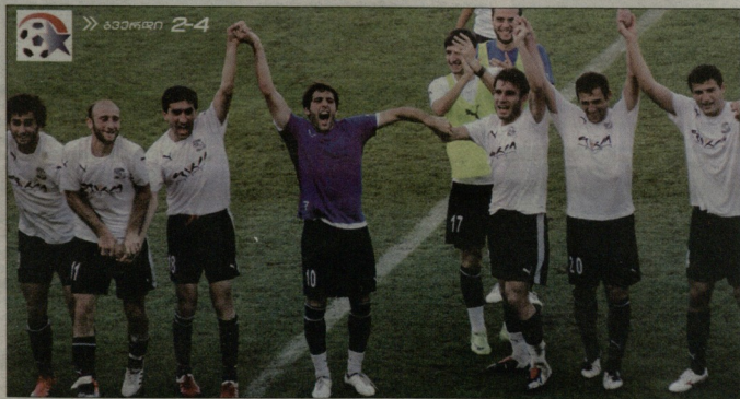
» ბაჟაძე 2-4