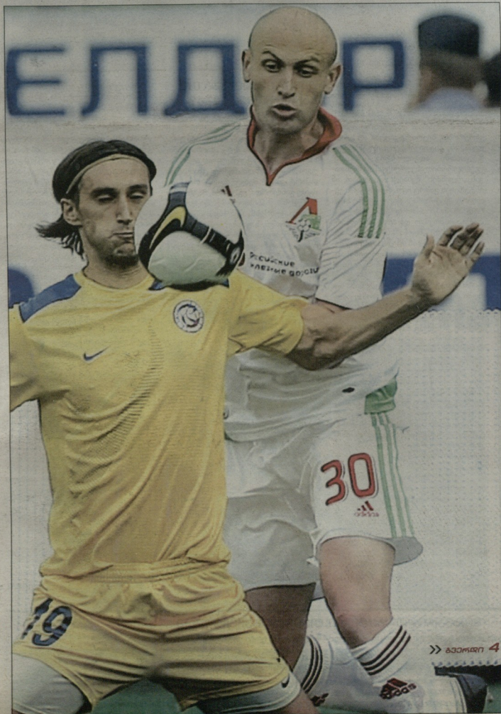
» ბაკორი 4

ჯირჯირბით, „მილანის“ ფანები უშედეგოდ ითხოვენ სავარელი კლუბის ბოსებისგან ბაზარზე გააქტიურებას, ყოველ შემთხვევაში, ამ მომენტისთვის ასეა - „როსონერის“ ხმაურისი შენაძენი არ გაუკეთებია, პირიქით, კაც „რეალში“ გაყიდა, ანდრე პირლოს „ჩელსი“ ექაჩება, თავად გუნდს კი წინასასეზონო ტესტმატჩებში ძალიან ცუდი შედეგები აქვს... საკითხავია, მეტი რაღა საჭირო იმისთვის, რომ სილიო ბერლუსკონიმ ქისა გახსნას? ჰოდა, ამბობენ, „მილანმა“ კლას-იან ჰუნტელარის ყიდა გადანყვიდა და ძალზე ახლოსა მიზანთანო. 25 წლის პოლანდიელი „რეალს“ ვერ შეეწყო და აკი მითითა (გაბრიელ ჰაინცესა და რაფაელ ვან დერ ვარტთან ერთად) კიდევ სამეფო კლუბის ახალმა დამრიგებელმა მანუელ პელეგრინიმ - შეგიძლია, ნახვიდეო, ესპანურ პრესაშიც დაინერა - თითქოს, „რეალმა“ და „მილანმა“ უკვე შეთანხმეს 11 მილიონ ევროდ ლირებული გარიგება. არადა, ცოტა ხნის წინათ „შტუტგარტი“ 18 მილიონ იძლეოდა და ესპანური გრანდი სიამოვნებითაც დაეპაულებოდა, მაგრამ... ფეხბურთელმა უშუალოდ გერმანულ კლუბთან ვერ მოლაპარაკა. „მილანთან“ მიმართებაში კი ასეთი რამ, ალბათ, არ მოხდება და შესაძლოა, შეთანხმება ამ კერძოზე გაფორმდეს.