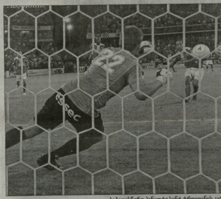
სახელისწილი ნახევარტი სინტი ტრუდენის კარი