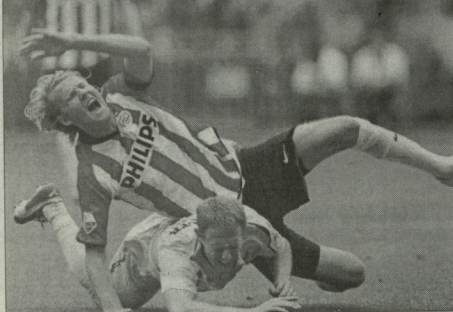
ინფორმაციის მკაცრი ოლა ტოიოვინი