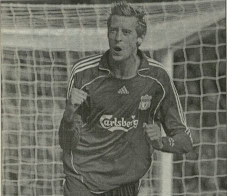
პეტერ კრაუნი შეიძლება ფოლსბერგზე გადავიდეს