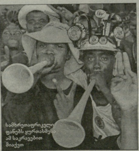
სამხრეთი-აფრიკელი მუსიკოსებისი მუსიკა