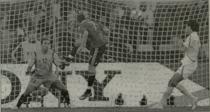
დაივი ვილიამსის გამარჯვების გოლი