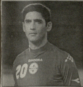
მუჯირს რუსეთი დაუკავს ისაშვილი კოლიტიკა?