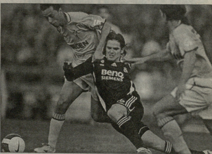
სელტა-რეალი. ფერნანდო გახო ორი გალისიელის გარემოცვაში

ნონები მნიშვნელოვანია, მაგრამ ფეხბურთი მონსტრად არ უნდა წარმოგაჩინოთ. ნუ დაგვაინცხდება, რომ საორტის ეს სახეობა ქვეყნისთვის მნიშვნელოვან სიმდიდრეს წარმოადგენს ფინანსური თვალსაზრისითაც", - განაცხადა აბეზემ პრეზიდენტად არჩევის შემდეგ. ახალ პრეზიდენტს პირველი დიდი გამოწვევა 18 აპრილს ელის, როცა უეფამ კარდიფში ევრო 2012-ის მასპინძელი ქვეყანა უნდა დაასახელოს. იტალია კი დიდი ფავორიტია. მისი კონკურენტები პოლონეთი-უკრაინა და უნგრეთი-ხორვატია არიან. "კარდიფის გადაწყვეტილება ძალიან მნიშვნელოვანია. ევროპის ჩემპიონატის მასპინძლობა მთელ ქვეყანას დიდ სიკეთეს მოუტანდა. ყველაფერს ვაგაკეთებთ იმისთვის, რომ ამ პრობლემაში ვაიმარჯვოთ", - თქვა აბეზემ.