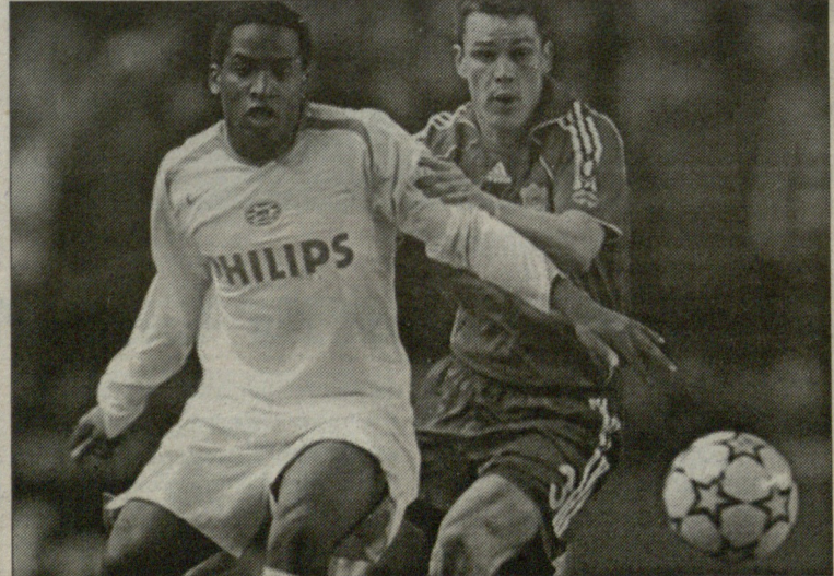
სტივ ფინი ჯერარდს ფარფანის წინააღმდეგ ლივერპული-ეინდოვენის ჯგუფური ტურნირის მატჩში

საპარაულშო შიმადგენლოზები ეინდოვენი: გომესი, კროკაპაში, და კომბა, ალსიდესი, სალსიდი, აფელი, მენდესი, სიმონსი, კოკუ, ფარფანი, კლუივერტი. ლივერპული: რენი, ფინენი, კარაგერი, აგერი, არბელა, პენანტი, ჯერარდი, ალონსო, რიისე, კრაუჩი, კუიტი. მსაჯი: ბერტრან ლიკი (საფრანგეთი)