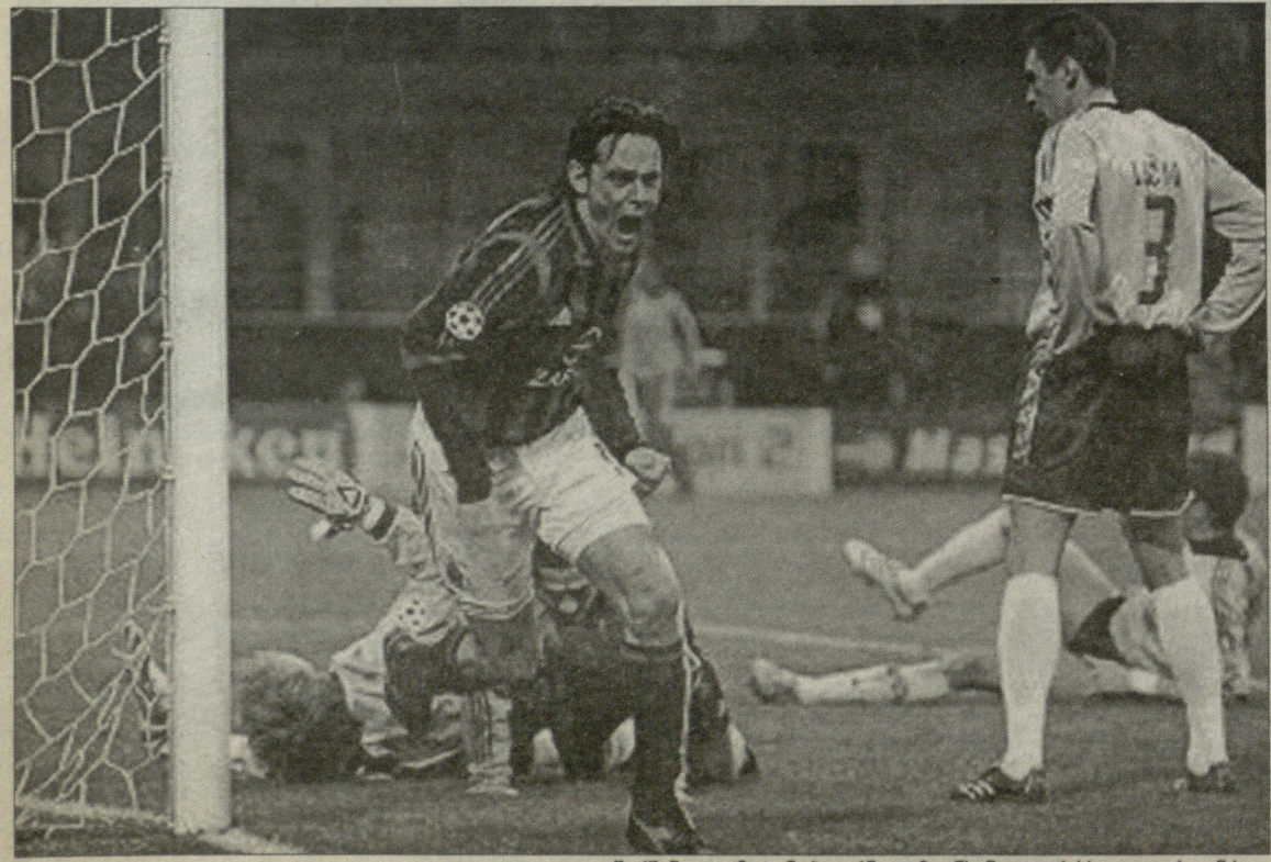
შარპანდელი მილანი ბაიერნი და მიუნხენელთა რისხვა ფილიპო ინცაგი

ლიგის ავტომატური საგზურით დაჯილდოვდეს. იდეას უფას ახლადშექმნილი სტრატეგიული კომიტეტი შეაფასებს. მასში შევლენ ფეხბურთელთა პროფკავშირის, ეროვნული ლიგებისა და კლუბების წარმომადგენლები. ამავე კომიტეტს განსახილველად გადაეცემა უფას პრეზიდენტ მიშელ პლატინის იდეა ნამყვანი საფეხბურთო ქვეყნებიდან ჩემპიონთა ლიგაში მონაწილე გუნდების რაოდენობის შემცირების შესახებ.