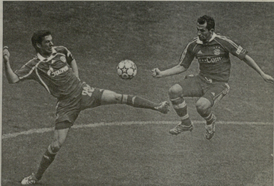
ჰასან სალიჰამიჯიჩისა და მლაღენ კრსტიჩიჩის დუელი ბაიერნი-შალკეს შაბათის მატჩში

- ალბათ იმიტომაც, რომ ტურნირს მიღმა თუ დარჩით, მინიმუმ კიდევ ერთი სეზონი გავა, სანამ "იუვენტუსთან" ერთად ვეროპულ ფეხბურთს დაუბრუნდებით.