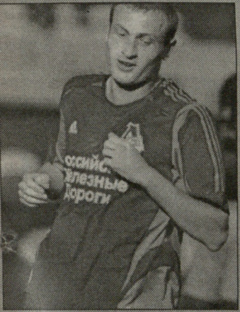
ასათიანი და ისაშვილი... არსენალისო სატრანსფერო სპეკულაციები საქართველოს ნაკრების ნახევარმცველებზე

ვფიქრობთ კონკრეტის გაგრძელებაზე. მიზანი უსვლეელია: მსოფლიო ჩემპიონაზზე გასვლა