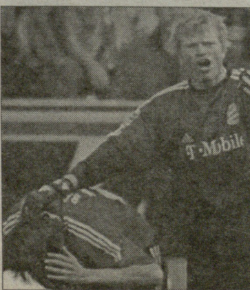
კანი შაპუიზას, პერლიხისა და ბრდარიჩის წინააღმდეგ