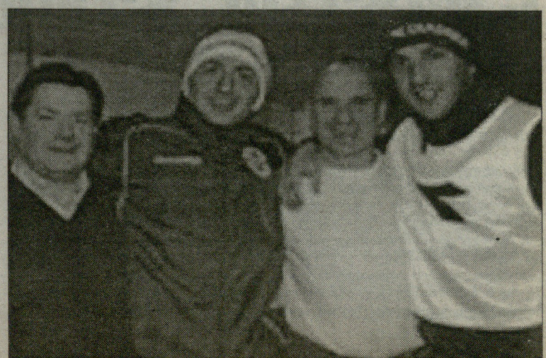
შეხვედრა ძველ ნაცნობებთან