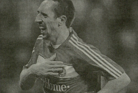
ფრანკ რიკარი უფლები გოლის შემდეგ...