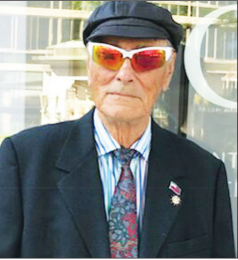
ასი წლის წინ, 1918 წლის 26 მაისს, მამა ჩემი დაიბადა საქართველოს დამოუკიდებლობის დღე და 100 წელი საქართველოს პირველი დემოკრატიული რესპუბლიკის დაარსებიდან - ეს არის ჩვენი სახელმწიფოებრივობის უმნიშვნელოვანესი ისტორიული თარიღი. კიდევ ერთხელ გილოცავთ, მრავალს დავესწროთ ერთიან და ძლიერ საქართველოში!

ბიან დარბაზში, მამაჩემმა, ნოე ჟორდანიამ გამოაცხადა საქართველოს დამოუკიდებლობა. ეკვდარეშა, რომ ეს იყო ყველაზე უფრო მნიშვნელოვანი დღე მეოცე საუკუნის საქართველოს ისტორიაში. იმასაც კი ვიტყვი, რომ ეს იყო საქართველოს ყველაზე მნიშვნელოვანი თარიღი ბოლო 700-ზე მეტი წლის განმავლობაში, დიას, მას მერე, რაც მონღოლებმა დაიპყრეს საქართველო 1238 წელს. საუკუნეების გავლის მერე საქართველო პირველად გახდა დამოუკიდებელი და ერთიანი ქვეყანა, მას ჰყავდა დემოკრატიულად არჩეული და განათლებული მთავრობა, რომელსაც ხელმძღვანელობდა პრეზიდენტი ნოე ჟორდანი. ერთიანობისა და დამოუკიდებლობის გზა იყო გრძელი და სირთულეებით აღსავსე. ქართველებს ჰქონდათ მრავალსაუკუნოვანი და ძლიერი კულტურა, მაგრამ არ