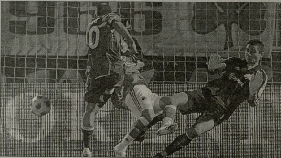
რეინერის მერვედფინალი ნოვის ამ გოლმა გაიგვანა

ბუნდესლიგითაგან ყველაზე უარეს დემონსტრაციას "ნორინგერს" იყო. ფრანკენს ლასანობის "ზენიტსთან" ჰქონდათ სექსუ და პირველი თამაში პორტუგალიის დედაქალაქში 0:1 ნაჯივს. თუმცა ეს არ იყო გამოვლინი მდგომარეობა და ისიც უნდა ითქვას, რომ თამაში ფრანკენს შევირდებმა იმის კვლობაზე, რომ გერმანიის შემოინტრუიტი ძალიან ცუდად გამოიყურებინ, "ზენიტსთან" საქაივად კარგად ითამაშეს. "ნორინგერს" ანგარიშს გახსნა პირველ ტაიმში რანდერემ შეიქო, მაგრამ ფრანკენსთან (მე-4 ნოტი), მერე კი სანკო (45) კარგი მომენტები ვერ გამოიყენეს. ლასანულითაგან კი, პირველ ნახევარში საუკეთესო შანსი ჰქვდათ მიცა, რომელსაც ასევე ვერ იგარა.