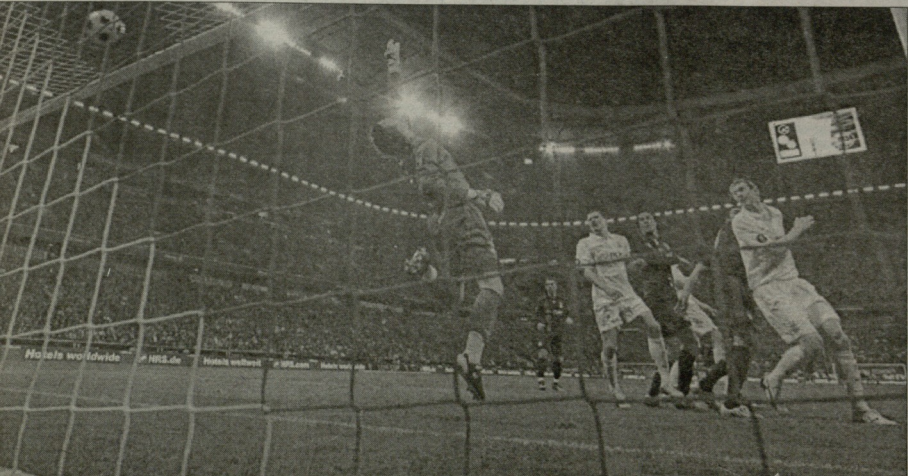
პარტიკანი-პარტიკანი, ვან ბუიციგს გაიქვიდა გოლი მოტლანდელთა კარში

პირველი მატჩები 8 მარტს გაიმართება, საბასუშო 13 მარტს