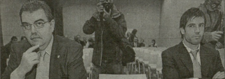
ვალენსიის პრეზიდენტი ხუან პაბლო სოლერი და დიეგო ალბალა

რაული არაგონსი მოსწონდა და მასწავლებელი შპრიბლენე უნდა დაეღობა. მთელი შეხვედრა დახურულ კარს მიღმა პირისპირა საუბრის ამის შემდეგ კი ფედერაციაში საკანცელარო გამოხატული ურთიერთობებისთვისაა მოივალს.