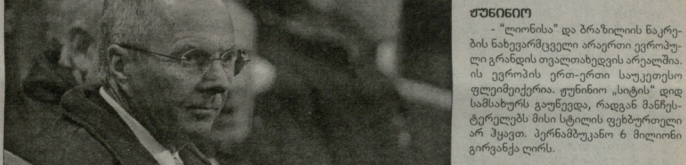
სევი გორანი გორანი

ზაფხული ტრანსფორმირის ანჟინისტიკის დი ფსლ დანარკავანი