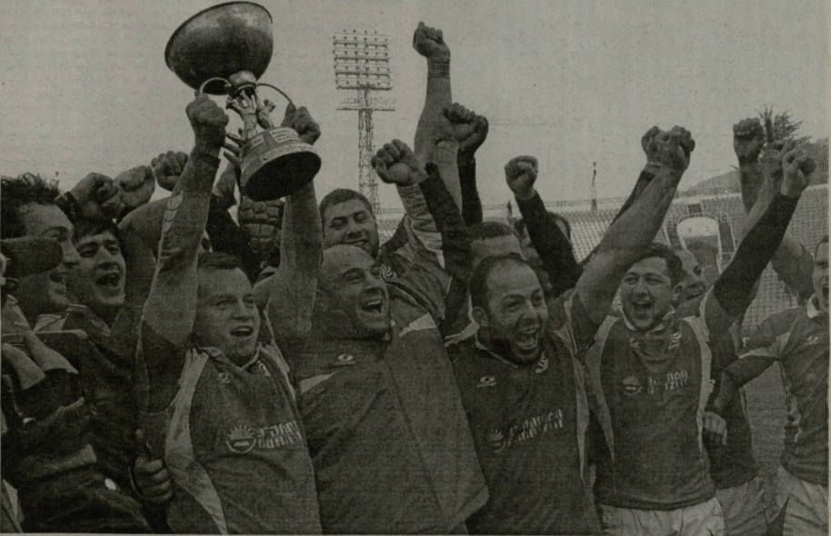
შაბათი. საქართველოს ნაკრები ანთიმოზ ივერიელის თასით