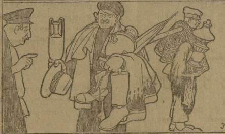
ესეც ხომ ვაჭრობს.