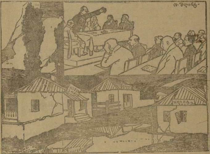
ახალი ქალაქი კულ-რაჭა*) მისი ახლად არჩეული საბჭო.