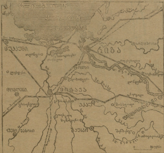
ბ. რიბა და მისი რაიონი.