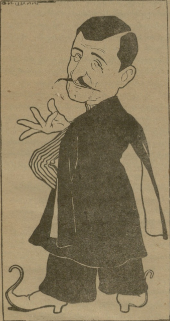
— ისევე ჩემი ხათაბალა, თორემ შიმშილით კუკი გამოიხმებოდა. ეს რა ღრო დაღვა გეთაყვა!..