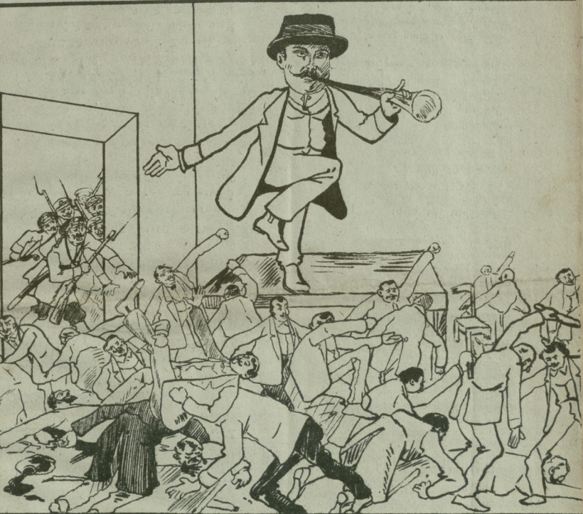
რალაც ოხერი ფოთია, მუღამ ჩხუბი და შფოთია..

ზოგი ერთას თუმცა ვი ეწყინება, ამის გამოთ გულში შევიგინება; ღმერთო მიეც მკირედა მარტინებს, და როდესაც ცრემლს დაუდინება მასაც ზედება ჩემისთანის როლია, მაშინ იგრძნობს რომ მიზეზი ცოლია. ან. განჯის-კარელი.